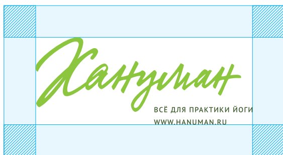
Размер охранного поля для фирменного блока с таглайном в две строки